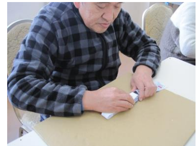
袋詰め作業の様子