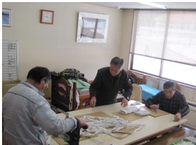
ゴム巻き作業の様子

穴水町の吉田製紐株式会社より、織ゴムの袋詰め作業を受託し、取り組み始めました。新しい作業が決まったことで、利用者のモチベーションアップにも繋がっています。利用者と職員が一丸となって、本作業へ丁寧に取り組んでいきたいと思えます。