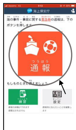
通報ボタンを選択