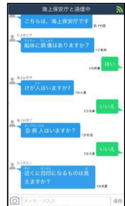
チャット形式により通話

海上保安庁 HP < https://www.kaiho.mlit.go.jp/doc/tel118.html >