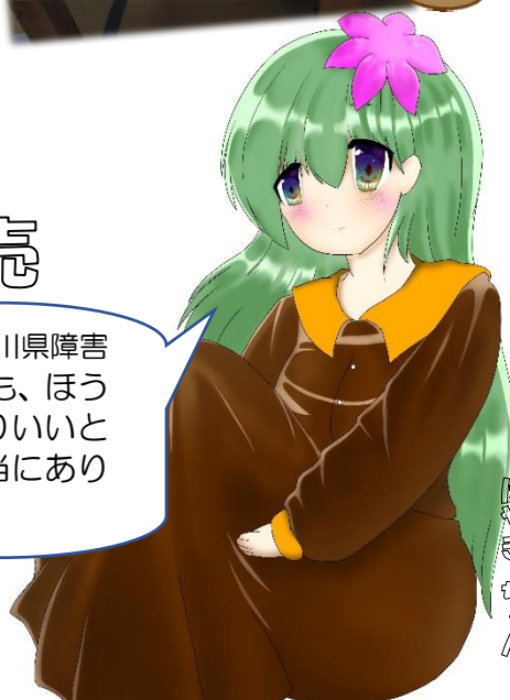
やなぎだハウス キャラクター けやぎちゃん

最近、やなぎだハウスへボランティアさんにきていただき、作業の手伝いや利用者との交流をしていただいています。おかげさまで作業がはかどっています。本当にありがとうございます。今後ともどうぞよろしくお願いいたします。